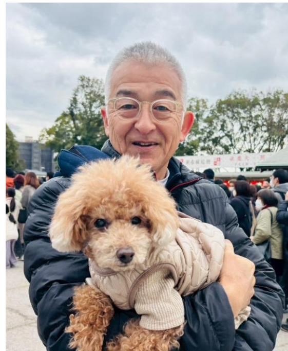
愛犬とのツーショット写真